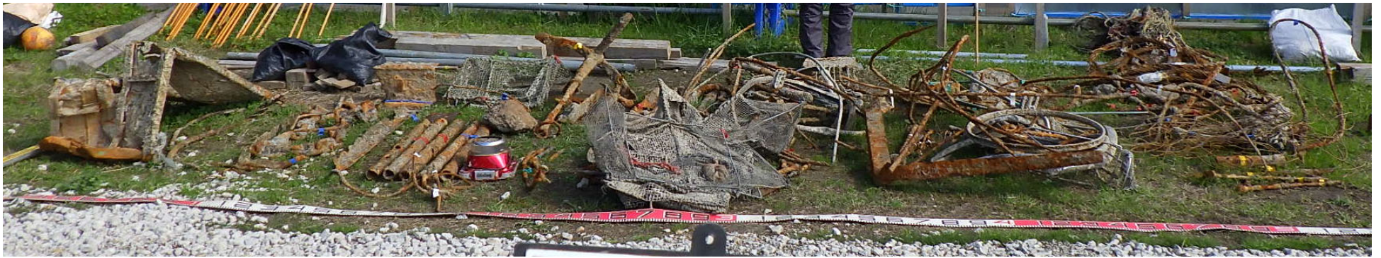
R7磁気探査 磁気異常点 揚収物一式